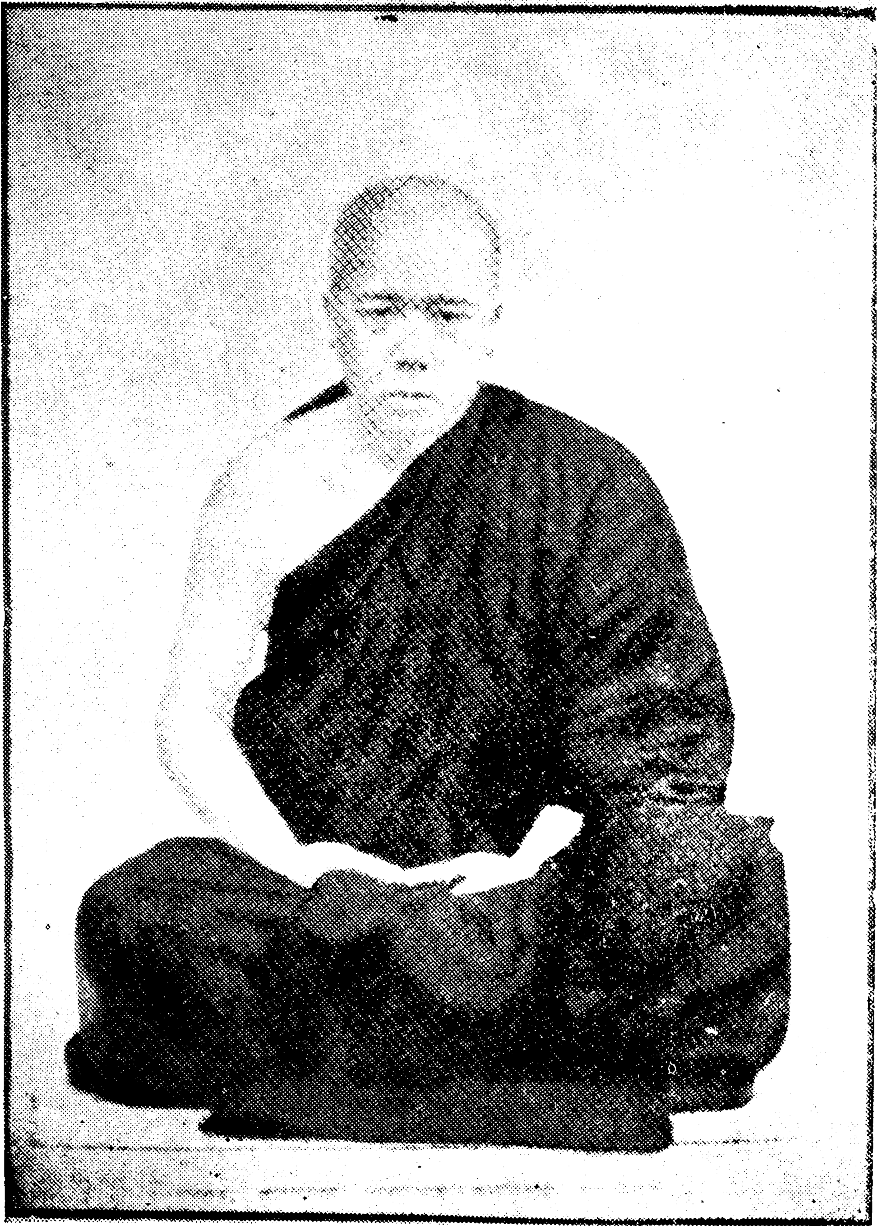
သဒ္ဓမ္မပါလ ကမ္မဋ္ဌာန်းဆရာတော်၏ ပုံတော်။