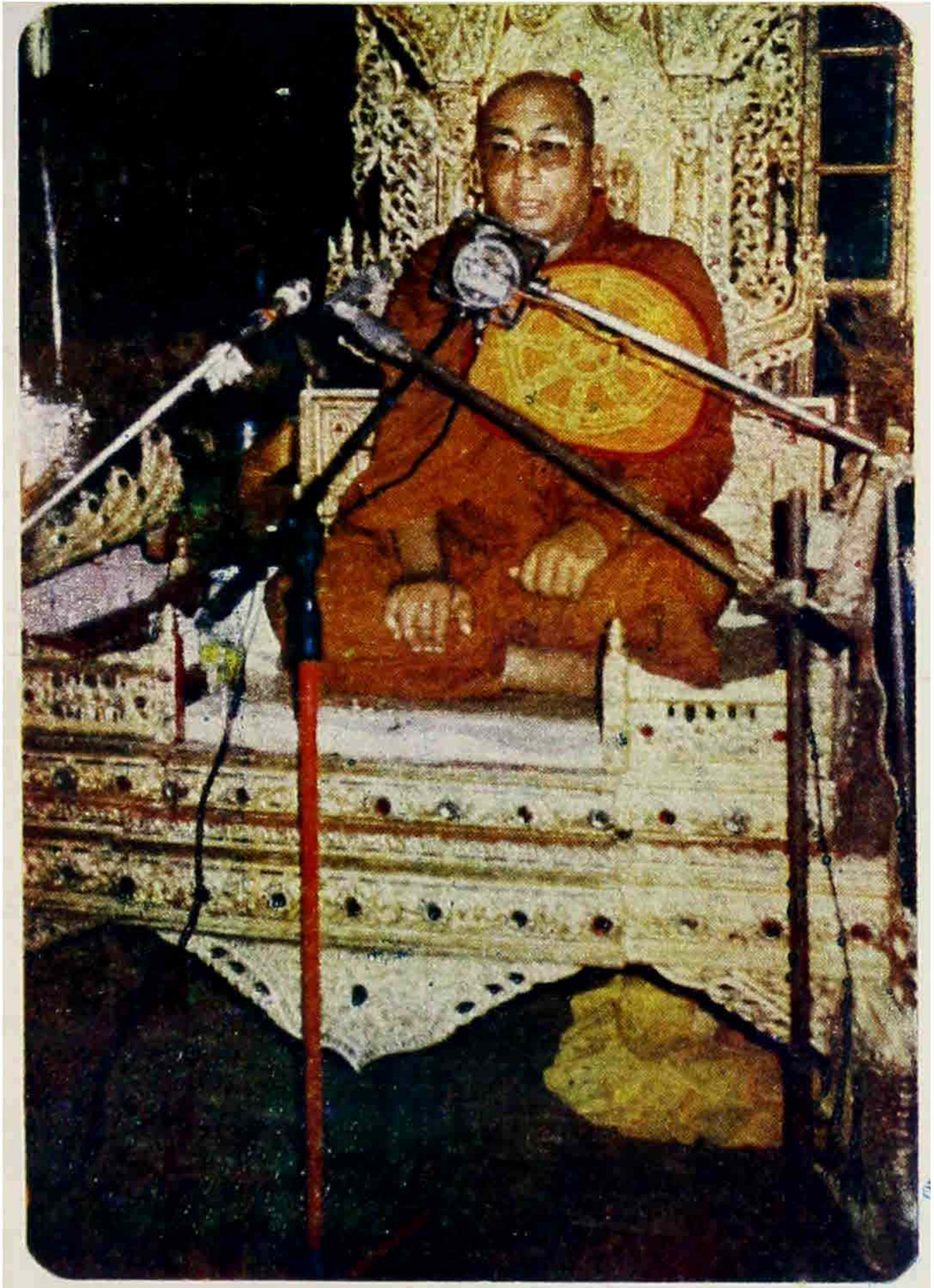
(ဆဲဘုရား) အရှင်ဥပုသိယာတော်