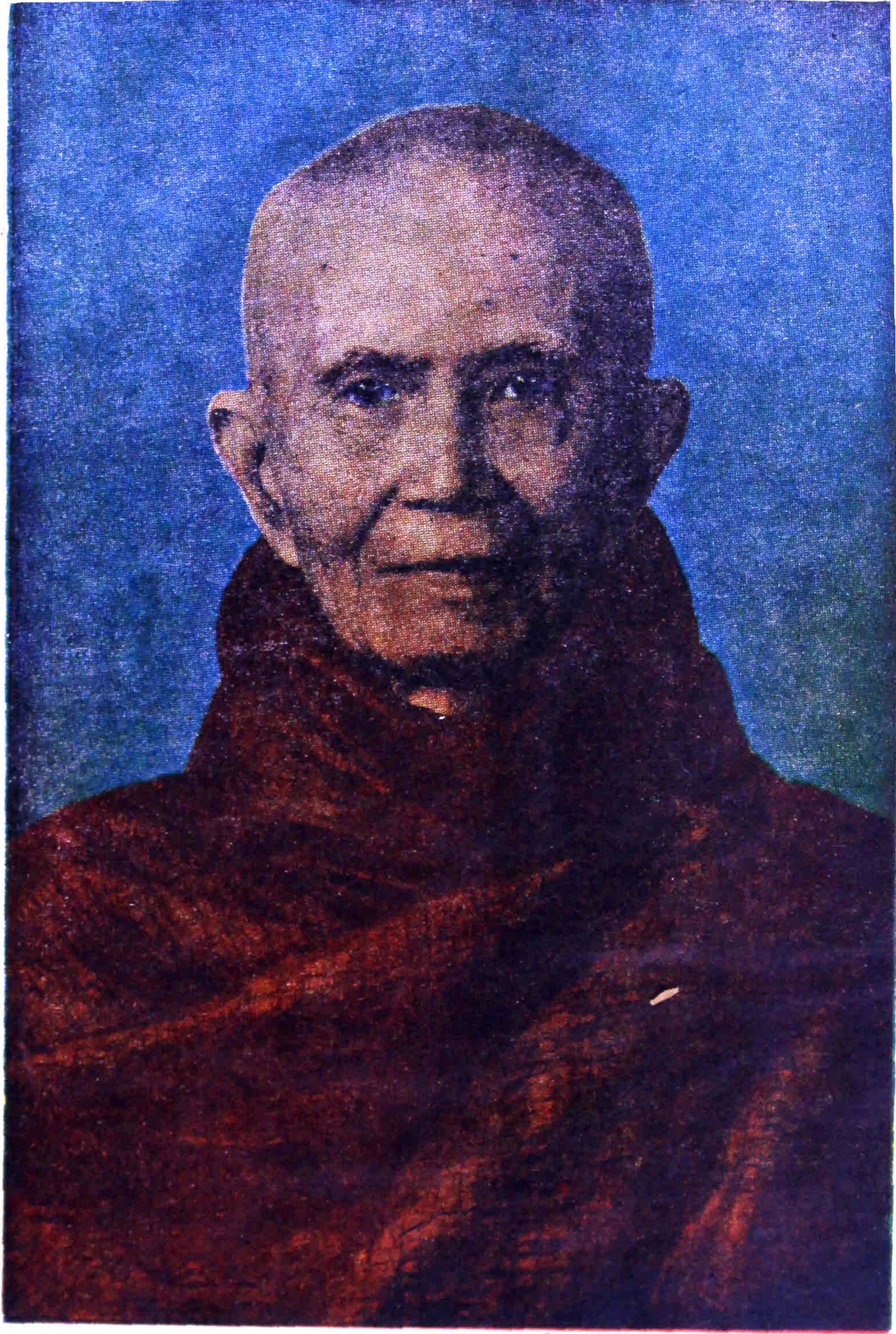
အဂ္ဂပဟာပဏ္ဍိတ ဘွဲ့တံဆိပ်တော်ရ မုန့်ကုန်မြို့၊ ပြည်လမ်း၊ ပဋ္ဌာန်းကျောင်းတိုက် မှလ ပဋ္ဌာန်းဆရာတော် အဋ္ဌန္တရာရဒ