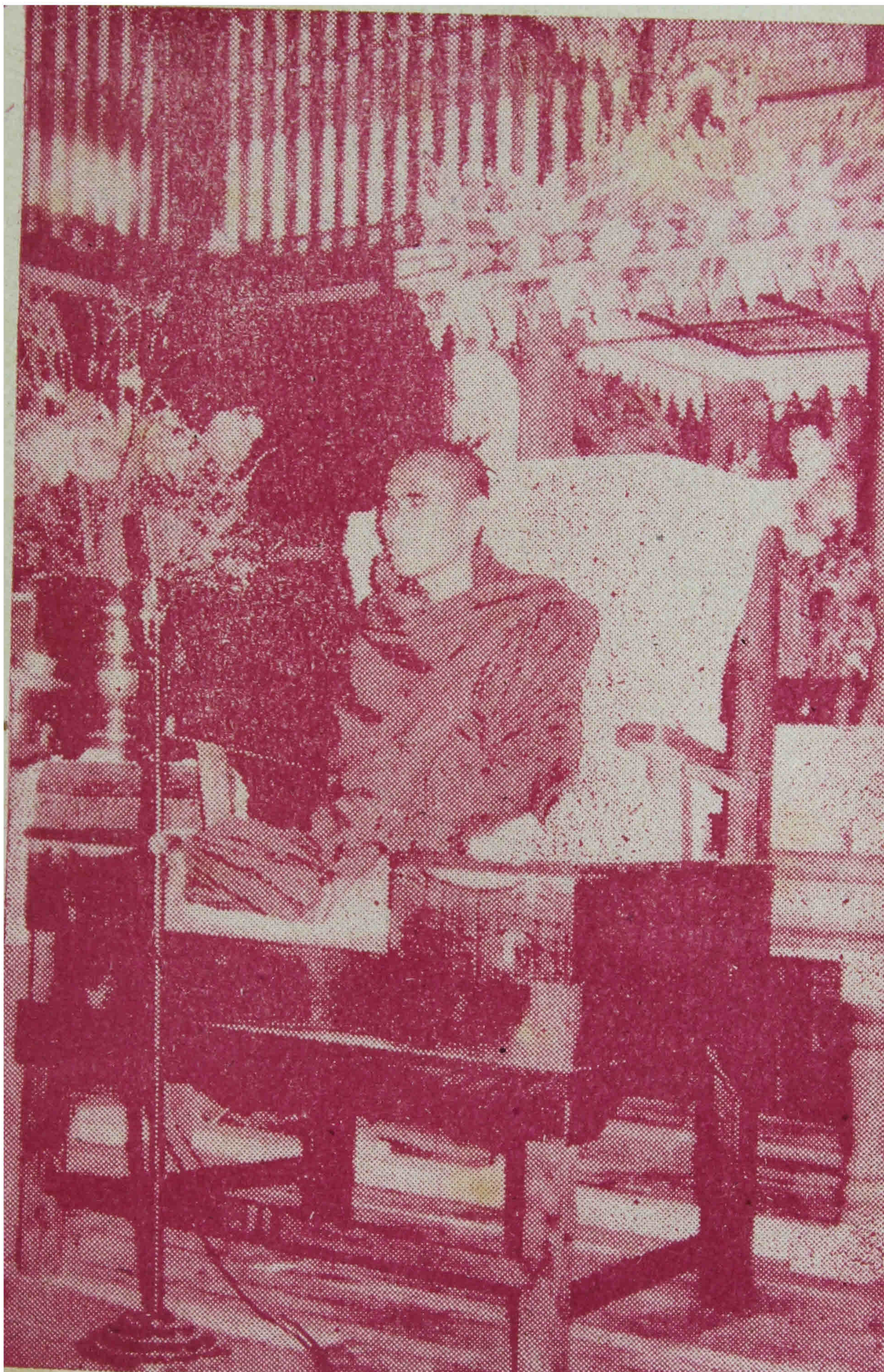
သီတဂူကျောင်း ရေစက်ချပွဲ၌ အနုမောဒနာတရား ဟောကြားနေပုံ။