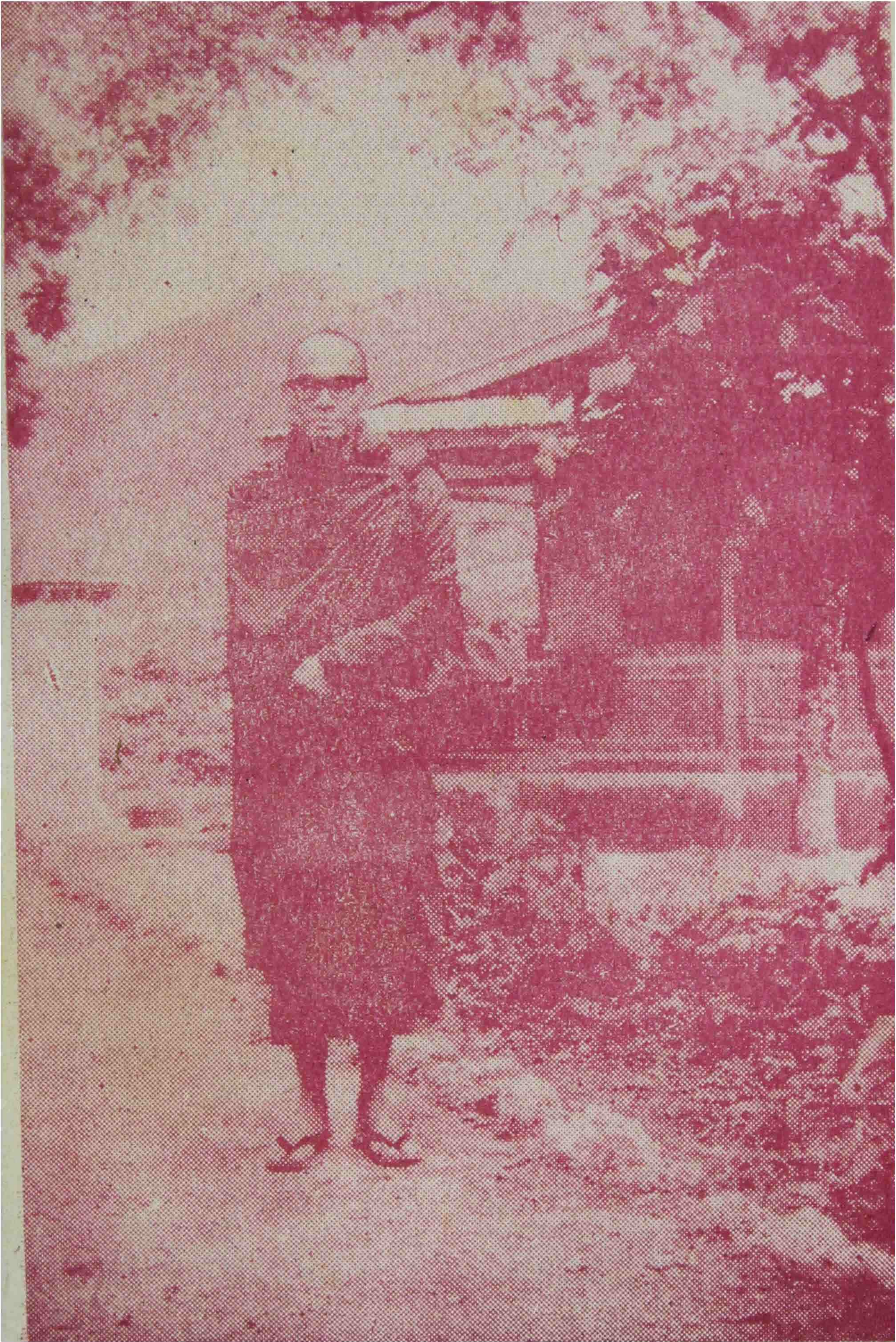
ကျောက်တလုံးတောရမှ ဆွမ်းခံထွက်လာသော ကျားကူးဆရာတော်။