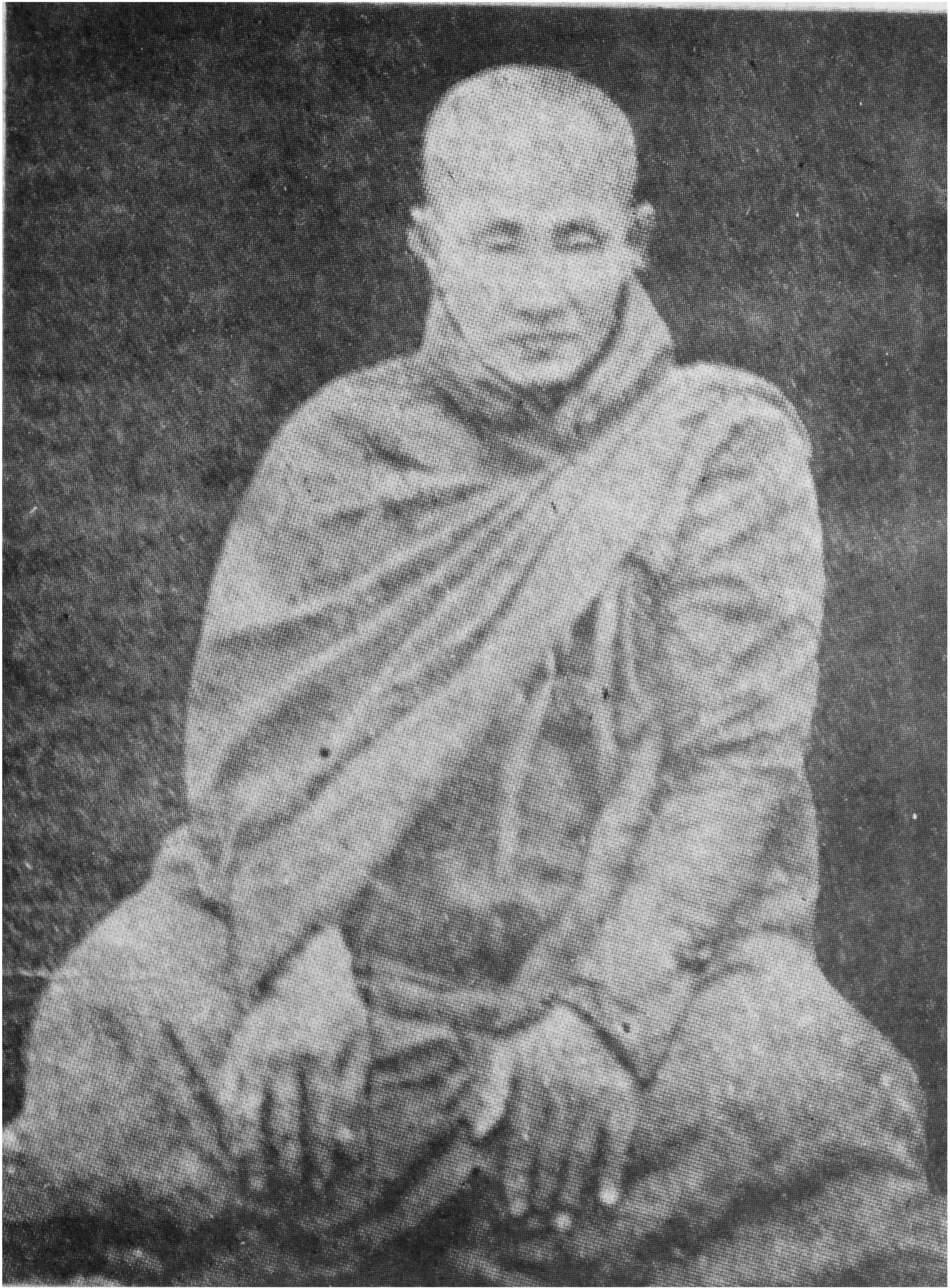
သပိတ်အိုင်တောရဆရာတော်ဦးကိတ္တိပုံတော်